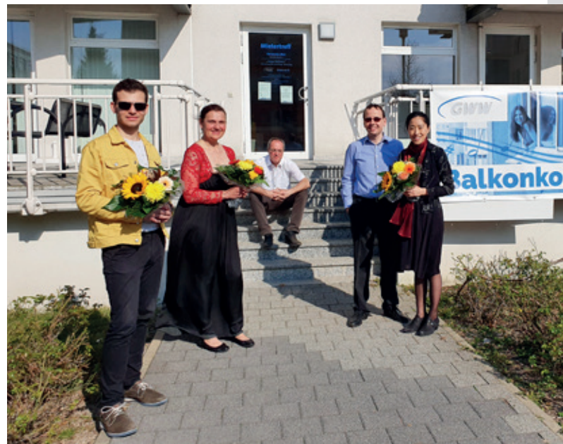
Orchestermusiker spielten mit viel Beifall vor dem GWV-Seniorenwohnen.