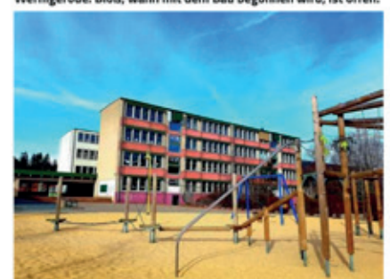
Nach dem Neubau der Franckeschule in Wernigerode soll das alte Gebäude abgerissen werden.

Bauherr will keine Zeit verlieren Die Weichen sind gestellt für den Neubau der Franckeschule in Wernigerode. Bloß, wann mit dem Bau begonnen wird, ist offen.