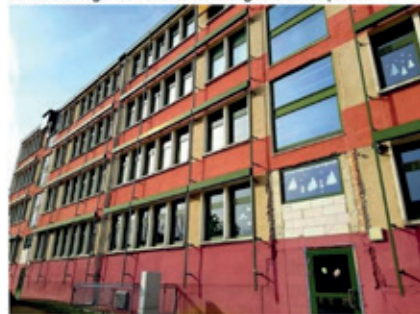
Die Francke-Grundschule wurde 1976 als Polytechnische Oberschule erbaut. Das Gebäude ist inzwischen in die Jahre gekommen.

Stadt liebäugelt mit Schul-Neubau Sanierung oder Neubau - das ist bei der Wernigeröder Franckeschule die Frage. Die Variante Sanierung scheint nun passé.